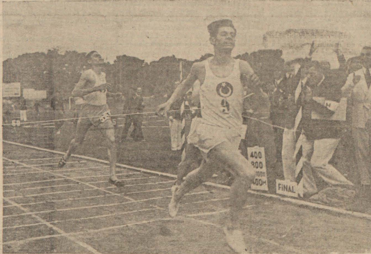
Dünkü müsabakalardan bir intiba

Yunanlılar dünkü oyunlarla Balkan birincisi oldular, derecelere göre biz ikinciyiz